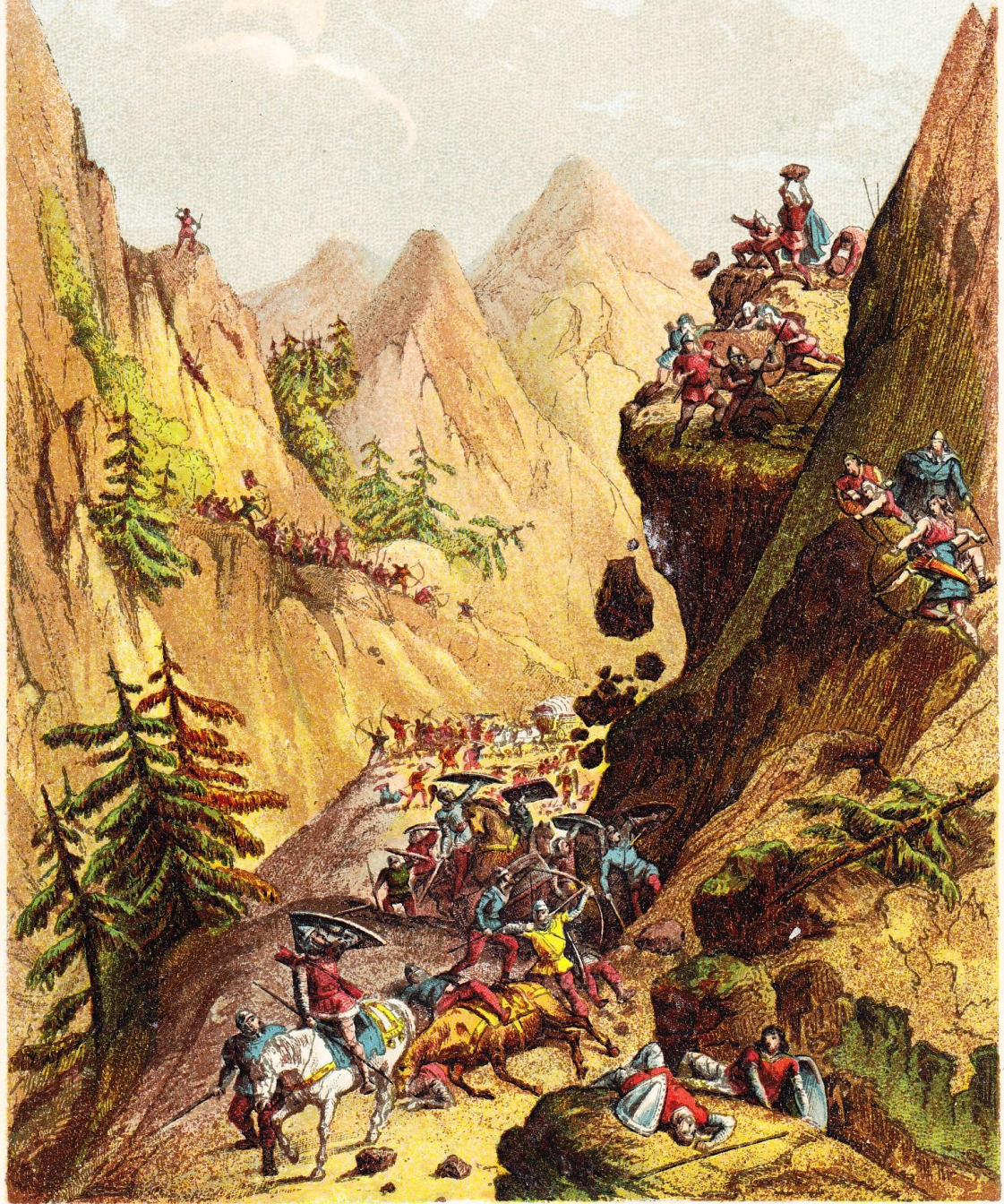
C. Severeyns, Chromolith.