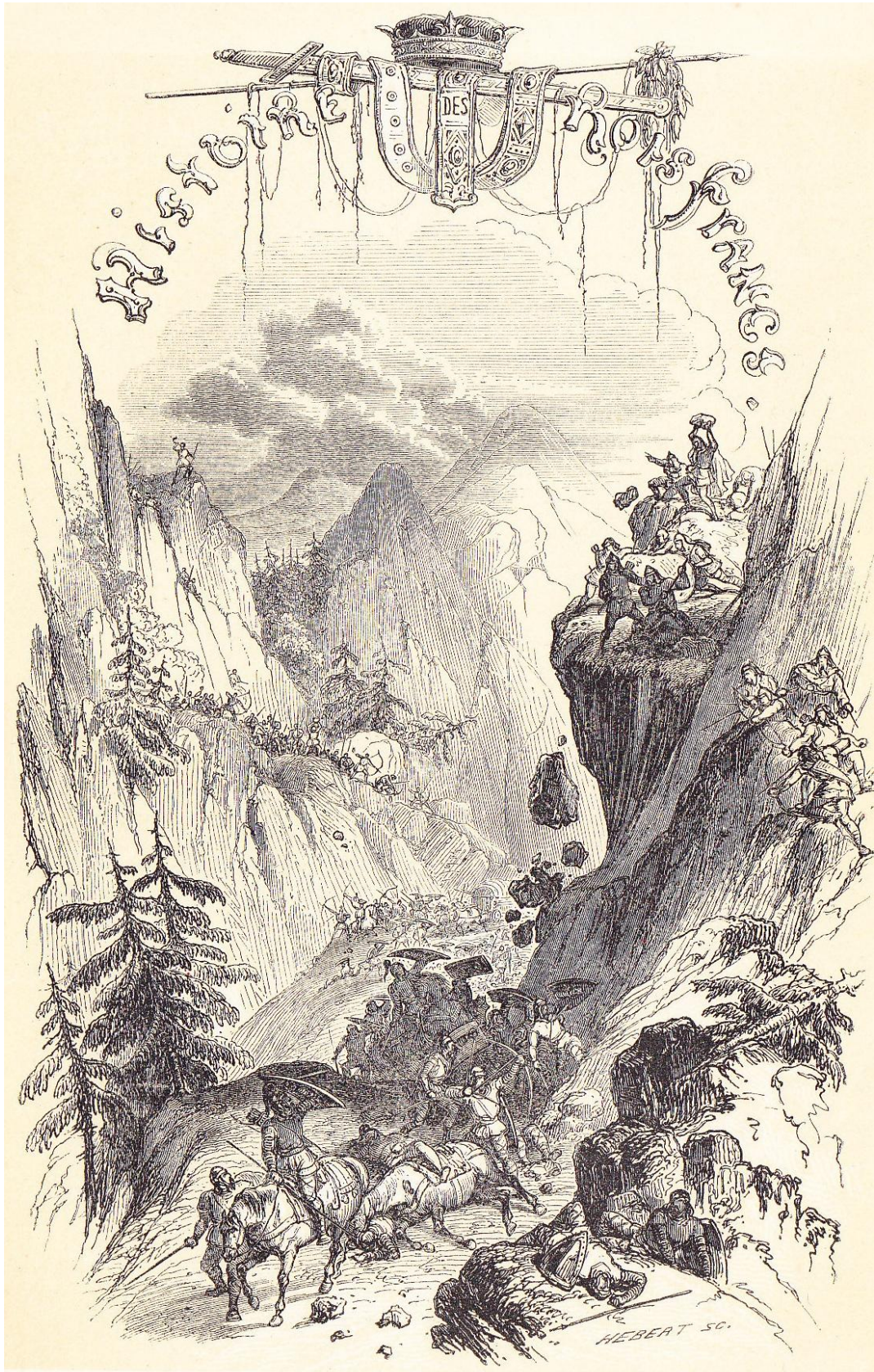
Passage des Pyrénées.